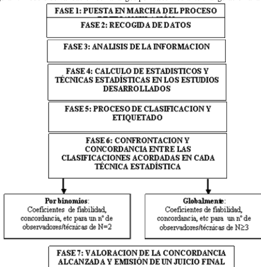
Figura 1. Modelo de validación de hallazgos por fases mediante triangulación analítica.

Así pues, tomando como objeto de estudio una investigación de encuesta y el modelo explicitado, estas son las fases desarrolladas: